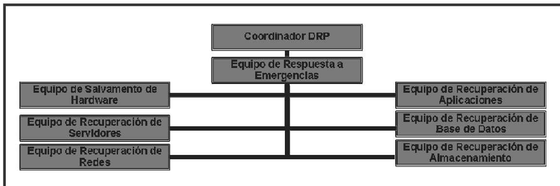
Figura 3. Roles y responsabilidades para desarrollar un DRP.